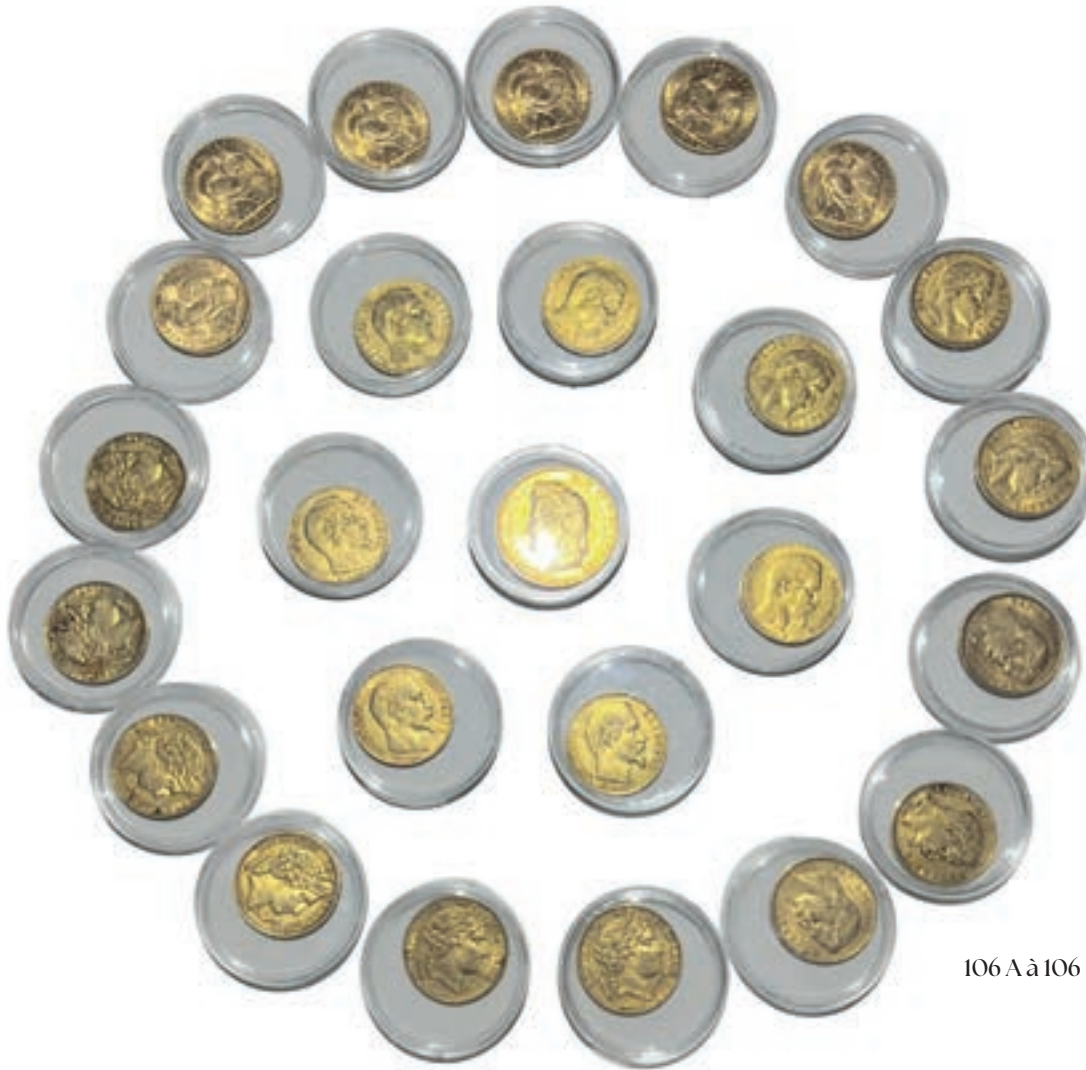
106 A à 106 H