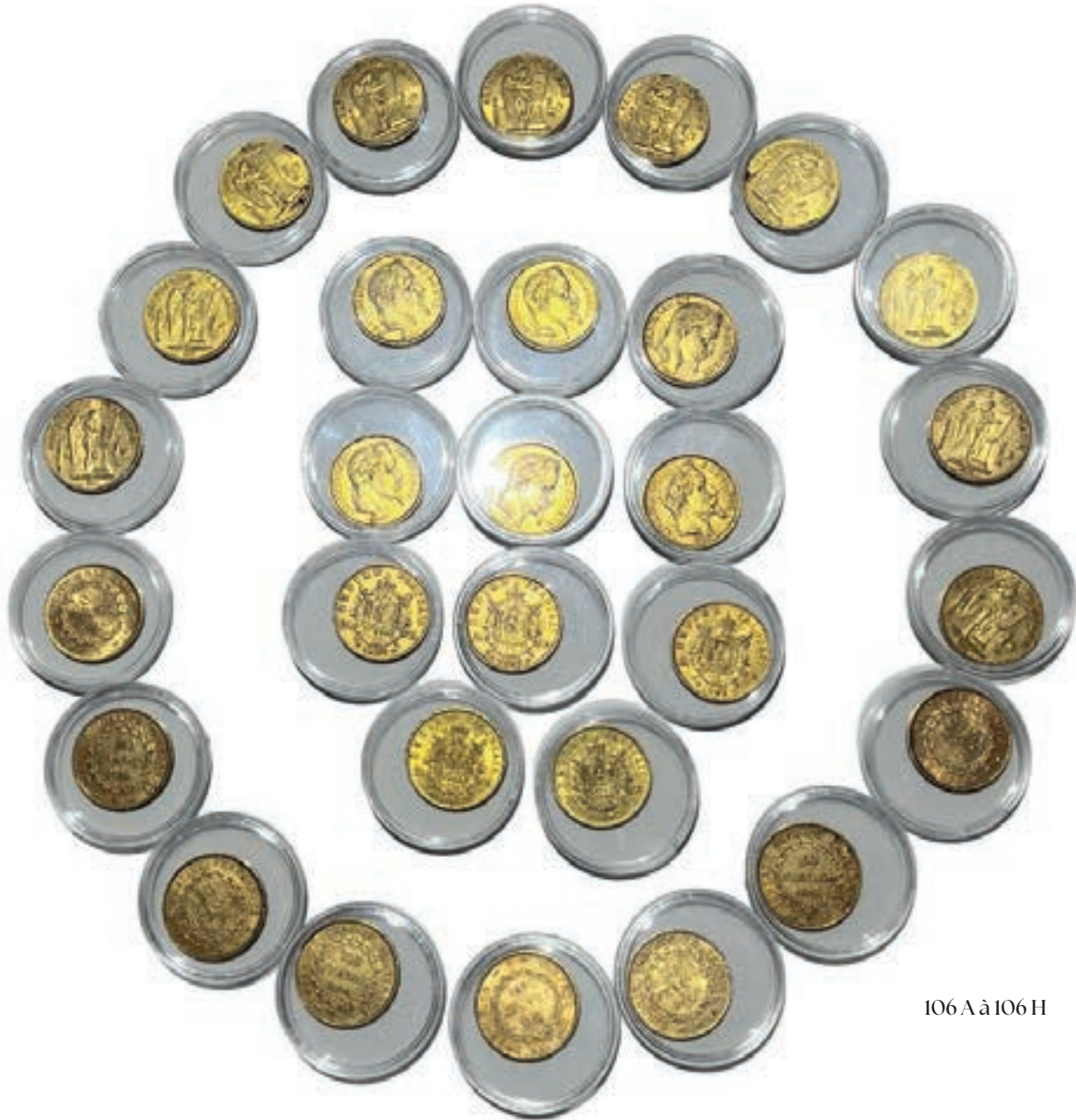
106 A à 106 H