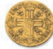
26 Louis juvénile tête nue. Paris. 1668. (Dr. 319). 6,63 g. Légère cassure de flan, portrait retouché sinon Presque Très Beau. 300 / 400 €