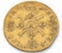
32 Louis aux 4 L. Rf. Lille . 1693. (Dr. 348). \frac{1}{2} louis aux 4 L. Rf. Atelier ? 1695 . (Dr. 373). Ens. 2 p. 6,67 g. 3,29 g. Traces sur la tranche . TB. 600 / 700 €