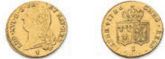
46 Double Louis au buste nu. Limoges. 1786. (Dr. 802). Or. 15,20 g. Presque Très Beau. 500 / 600 €