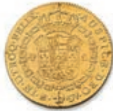
58 ESPAGNE. CHARLES III (1759-1788). 4 escudos. Madrid. 1787. (Fr. 284). 13,44 g. Traces de monture. TB. 400 / 500 €