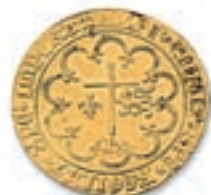
11 HENRI VI (1422-1453). Salut d'or. Rouen. (Dy. 443A, L. 447a). 3,47 g. Très Beau. 1 200 / 1 500 €