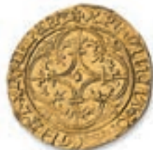
9 Ecu d'or à la couronne. (Dy. 369, L. 376). 3,90 g. Très Beau. 400 / 500 €