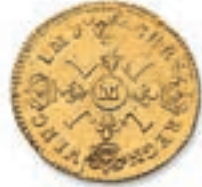
31 Louis aux 4 L. Rf. Toulouse . 1695. (Dr. 348, Dy. 1435a). Or. 6,67 g. Traces de griffes sinon Très Beau. 300 / 400 €