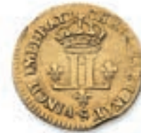
37 Louis aux 2 L. Rf. Reims . 1722. (Dr. 724). Or. 9,83 g. Trace de soudure, coups sur la tranche sinon TB à Très Beau. 500 / 600 €