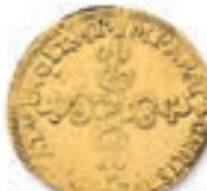
20 LOUIS XIII (1610-1643). Ecu d'or. Paris. 1615. (Dr. 1). Or. 3,29 g. Traces de monture sinon Très Beau. 200 / 300 €