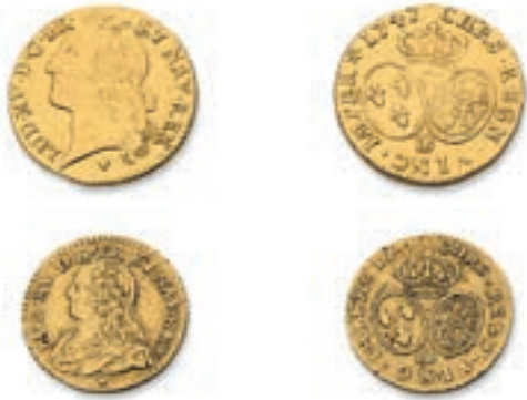
41 Louis au bandeau. Strasbourg. 1747. (Dr. 543). 1/2 Louis aux lunettes. Strasbourg. Date illisible. (Dr. 541). Or. 8,06 g. 4,06. Ens. 2 p. TB à Très Beau. 500 / 600 €