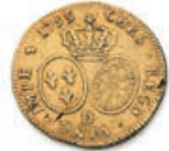
35 LOUIS XV (1715-1774). Double louis au bandeau. Lyon . 1759. (Dr. 718). Or. 16,23 g. Quelques coups sinon TB à Très Beau. 500 / 600 €