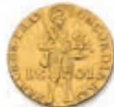
73 PAYS-BAS. Ducat au chevalier. 1801. (Fr. 317). Très Beau. 150 / 200 €