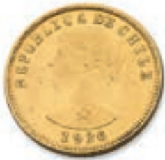
67 CHILI. 100 pesos-10 condors. 1926. (Fr. 54). 20,33 g. Très Beau. 700 / 800 €