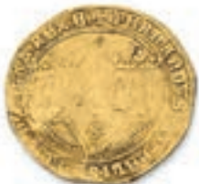
69 ESPAGNE. FERDINAND et ISABELLE (1476-1516). Double excellente. Séville. (Fr. 129). 6,95 g. Traces de soudure. TB. 200 / 250 €