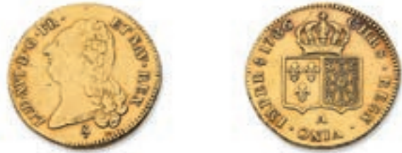
45 Double Louis au buste nu. Paris. 1786. (Dr. 802). Or. 15,25 g. Très Beau. 500 / 600 €