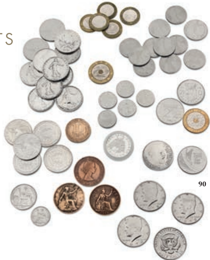
89 XIX e - XX e siècle. 50 francs (13), 10 francs (5), 5 francs, piastre, piastre de commerce. Arg. Ens. 21 p. Très Beau. 150 / 200 €