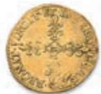
18 CHARLES IX (1569-1574). Ecu d'or au soleil. 1 er t. Rouen. 1562. (L. 890 var., Dy. 1057). 3,32 g. Traces de pli et de monture sinon TB. 200 / 300 €