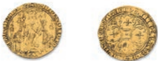
5 JEAN le Bon (1350-1364). Royal d'or . 2 ème ém. (Dy. 293A, L. 296a). 2,36 g. Tranche irrégulière, traces de plis sinon Très Beau. 800 / 1 000 €