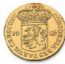
63 PAYS-BAS. 14 gulden. 1750. (Fr. 288). 9,68 g. Traces de monture sinon Très Beau. 500 / 600 €