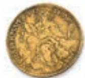
74 VATICAN. CLEMENT XIII (1758-1769). Sequin. 1766. (Fr. 237). 1/2 sequin. 1758. (Fr. 238). Ens. 2 p. 3,39 g. 1,70 g. Presque Très Beau. 250 / 350 €