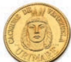
76 VENEZUELA. Médaille de Caciques. 15 g. Superbe. 350 / 450 €