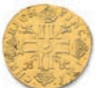
23 Louis à la mèche longue. Arras. 1656. (Dr. 216). 6,71 g. Traces sur la tranche. TB à Très Beau. 1432 ex. Un peu rare. 400 / 500 €