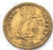
75 PIE VII (1799-1823). 2 scudi d'oro. Rome. An VIII (Fr. 248). PIE IX (1846-1878). 20 lire. 1867. (Fr. 280). Ens. 2 p. 5,39 g. 6,44 g. Presque Très Beau. 400 / 500 €