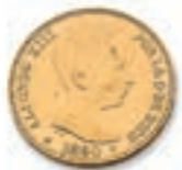
70 ALPHONSE XIII (1886-1931). 20 pesetas. 1890. (Fr. 345). Ens. 2 p. Très Beau. 400 / 500 €