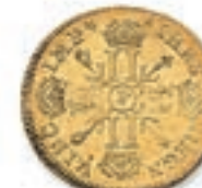
27 Louis aux 8 L et aux insignes. Rf. Dijon. 1702. (Dr. 270). 6,66 g. Très Beau. 300 / 400 €