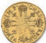
22 LOUIS XIV (1643-1715). Louis à la mèche courte. Lyon. 1651. (Dr. 213). 6,42 g. Traces de monture. TB. 300 / 400 €