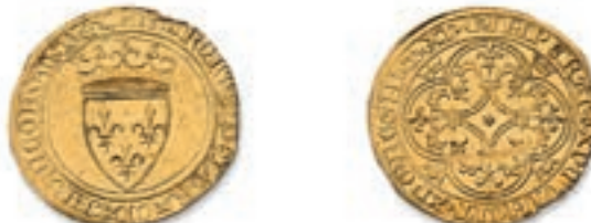
8 CHARLES VI (1380-1422). Ecu d'or à la couronne . (Dy. 369, L. 376). 4,03 g. Petit défaut de tranche sinon Très Beau. 300 / 400 €