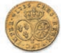
38 Louis aux lunettes. Nantes . 1735. (Dr. 727). Or. 8,15 g. Très Beau. 200 / 300 €