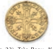
21 Louis à la mèche longue. Paris. 1641. (Dr. 23). Très Beau. \frac{1}{2} louis à la mèche longue. Paris. 1641. (Dr. 31). Or. Ens. 2 p. 6,71 g. 3,32 g. Traces de monture. TB. 600 / 700 €