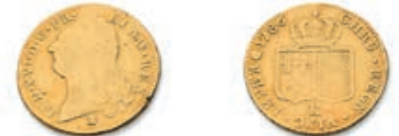
48 Double Louis au buste nu. Bordeaux. 1786. (Dr. 802). Louis au buste nu. Montpellier. 1786. (Dr. 806). Or. 14,67 g. 7,50 g. Ens. 2 p. Traces sur la tranche. TB et TB à Très Beau. 600 / 700 €