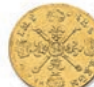
29 Louis aux insignes. Rf. Toulouse. 1704. (Dy. 1446, Dr. 351). 6,75 g. Légère échancrure et coups sur la tranche. Presque Très Beau. 300 / 400 €