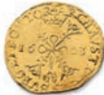
53 BELGIQUE. ALBERT et ISABELLE (1598-1621). Pièce de 2 Albertins. Tournai. 1603. (Fr. 389). 5,13 g. Tranche irrégulière sinon presque Très Beau. 200 / 300 €