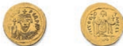
2 PHOCAS (602-610). Solidus . Constantinople . Buste de f. tenant le globe crucigère. R./ Victoire debout de f. tenant une longue croix et le globe crucigère. (Ratto 1187, Morrisson 10). 4,43 g. Très Beau. 200 / 300 €