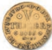
51 ALLEMAGNE. Brünswick Wolfenbüttel. KARL WILHELM FERDINAND (1780-1806). 5 thaler. 1805. (Fr. 726). 6,55 g. TB à Très Beau. 800 / 1 000 €