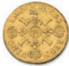
30 Double louis aux 4 L. Rf. Paris . Date illisible . (Dr. 265). 13,47 g. Presque Très Beau. 800 / 1 000 €