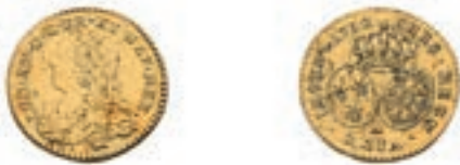
43 1/2 Louis aux lunettes. Paris. 1732. (Dr. 541). Or. 4,05 g. Très Beau. 200 / 250 €