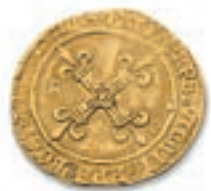
13 CHARLES VIII (1483-1498). Ecu d'or au soleil. 1 ère ém. Saint-Lô. (Dy. 575, L. 554). LOUIS XII. Ecu d'or au soleil. Montpellier. (Dy. 647, L. 592). Ens. 2 p. 3,31 g. 3,37 g. Traces de monture. TB et presque Très Beau. 400 / 500 €