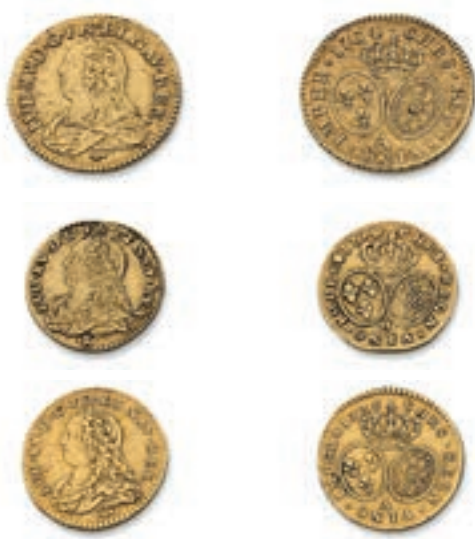
42 Louis aux lunettes. Paris. 1734. (Dr. 540). 1/2 Louis aux lunettes (2). Paris 1726. Toulouse 1730 (3.486 ex.). (Dr. 541). Or. 8,09 g. 4,01 g. 4,02 g. Ens. 3 p. Très Beau et presque Très Beau. 600 / 700 €