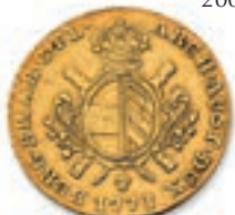
54 MARIE THERESE (1740-1780). Souverain. Bruxelles. 1771. (KM 24). 10,66 g. A été monté. TB. 400 / 500 €