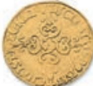
19 Ecu d'or au soleil. Paris. 1573. (Dy. 1057, L. 890). HENRI III (1574-1589). Ecu d'or au soleil. Rouen. 1583. (Dy. 1121, L. 960). Ens. 2 p. 3,36 g. 3,24 g. Très Beau. 500 / 600 €