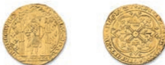
6 CHARLES V (1364-1380). Franc à pied . (Dy. 360, L. 371). Or. 3,81 g. Très Beau. 600 / 800 €