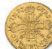
28 Louis aux 8 L et aux insignes. Rf. Paris. 1701. (Dr. 270). Or. 6,73 g. Très Beau. 300 / 400 €