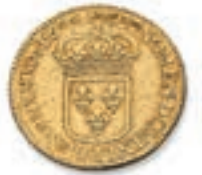
33 Louis à l'écu. Rf. Atelier ? 1690 . (Dr. 258). Or. 6,64 g. Profonde griffure au revers sinon Très Beau. 200 / 300 €