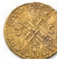
16 HENRI II (1547-1559). Double Henri d'or. La Rochelle. 1558. (Dy. 971, L. 809). 7,10 g. B. 600 / 700 €