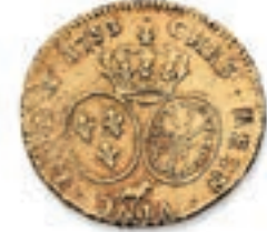
36 Double louis au bandeau du Béarn. Pau . 1753. (Dr. 718A, Dy. 1642). Or. 16,27 g. TB. 400 / 500 €