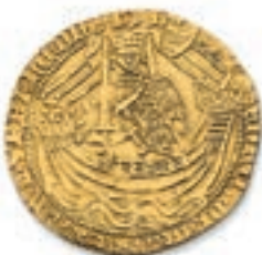
71 GRANDE-BRETAGNE. HENRI V (1413-1422). Noble à la rose. (Fr. 109). 6,94 g. Traces de monture sinon Très Beau. 600 / 800 €