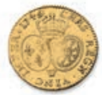
40 Louis au bandeau. Lille . 1746. (Dr. 543). Or. 8,13 g. Coup sur la tranche sinon Très Beau. 400 / 500 €