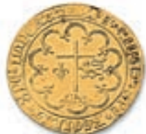
12 LOUIS XI (1461-1483). Ecu d'or à la couronne. Chalons. 1 ère ém. (Dy. 539, L. 524). 3,38 g. Flan très irrégulier sinon Très Beau. 300 / 400 €