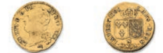
49 Louis au buste nu. Lille. 1786. (Dr. 806). Or. 7,62 g. Très Beau. 300 / 400 €