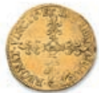
17 Ecu d'or à l'effigie. Bayonne. 1549. (Dy. 969, L. 807). 3,21 g. Traces de plis. TB. Rare. 1 200 / 1 500 €