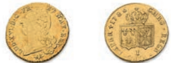
47 Double Louis au buste nu. Lyon. 1786. (Dr. 802). Or. 15,28 g. Coup sur la tranche sinon presque Très Beau. 500 / 600 €