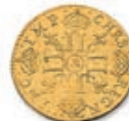
24 Louis à la mèche longue. Paris. 1653. (Dr. 216). 6,72 g. Très Beau. 300 / 400 €