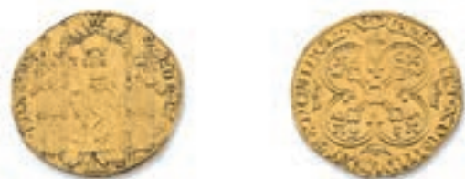
3 CHARLES IV (1322-1328). Royal d'or . (Dy. 240, L. 244). 4,20 g. Petites traces sur la tranche sinon Très Beau. 1 200 / 1 500 €