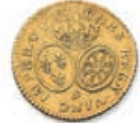
39 Louis aux lunettes. Rennes . 1739. (Dr. 727). Or. 8,13 g. TB à Très Beau. 200 / 300 €