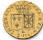
50 Louis au buste nu (2). Paris 1785, 1786. (Dr. 806). Or. 7,03 g. 7,34 g. Ens. 2 p. Trace de soudure, légère fente. TB à Très Beau. 400 / 500 €