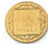
64 PAYS-BAS. Ducat au chevalier (2). Utrecht. 1758 (Fr. 285). 1928 (Fr. 352). Ens. 2 p. Très Beau et Superbe. 250 / 350 €