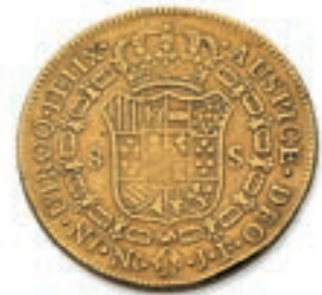
55 COLOMBIE. FERDINAND VII (1808-1824). 8 escudos. 1819. (Fr. 60). Or. TB. 600 / 700 €