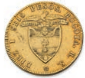
57 NOUVELLE GRENADE (1837-1859). 16 pesos. Bogota. 1840. (Fr. 74). Or. Coups sur la tranche. Très Beau. 600 / 700 €