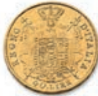
87 ITALIE. NAPOLEON I er (1805-1814). 40 lire. Milan. 1814. (Fr. 5). Or. Léger coup sinon Très Beau. 300 / 350 €