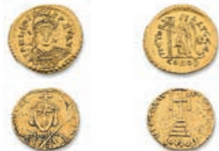
1 LEON I er (457-473). Solidus . Constantinople . (Ratto 245). TIBERE III Apsimar (698-705). Solidus . Syracuse . (Dumbarton.Oaks. 21H2). 4,48 g. 3,79 g. Ens. 2 p. Très Beau et TB. 500 / 600 €