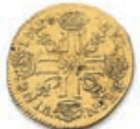
34 Louis au soleil. Faux d'époque. Lyon . 1709. (Dr. 278). Or. 8,07 g. Très Beau. 400 / 500 €