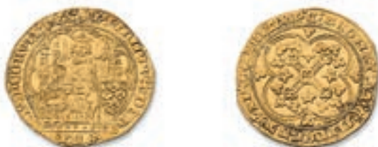
4 PHILIPPE VI de Valois (1328-1350). Ecu d'or à la chaise . 1 ère ém. (Dy. 249, L. 262). 4,28 g. Traces sur la tranche sinon Presque Très Beau. 700 / 900 €