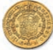
59 2 escudos. Madrid. 1776. (Fr. 288). 6,69 g. Coups sur la tranche sinon Très Beau. 200 / 300 €