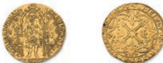
7 Franc à pied . (Dy. 360, L. 371). Or. 3,79 g. Presque Très Beau. 500 / 700 €