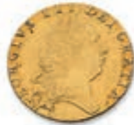
72 GEORGE III (1760-1820). Spade guinée. 1797. (Fr. 356 var.). 8,34 g. Très Beau. 400 / 500 €