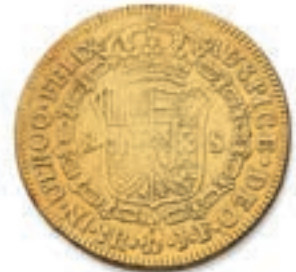
56 8 escudos. 1819. (Fr. 60). Or. Traces de monture. TB. 600 / 700 €