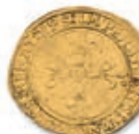
15 FRANÇOIS I er . Ecu d'or au soleil. Lyon. 5 ème t. 2 ème ém. (Dy. 775, L. 639). Ecu d'or au soleil du Dauphiné. 1 er t. Crémieux. (Dy. 782, L. 645). 3,40 g. 3,40 g. Ens. 2 p. TB à Très Beau. 400 / 500 €