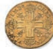
25 Louis juvénile lauré. 1 er t. Paris. 1658. (Dr. 220). 6,72 g. Presque Très Beau. 300 / 400 €