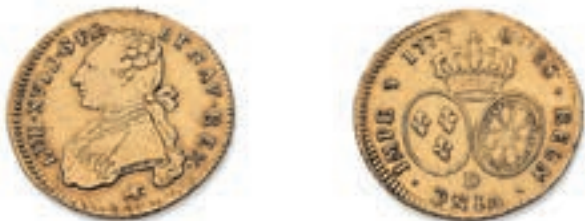
44 LOUIS XVI (1774-1793). Double Louis au buste habillé. Lyon. 1777. (Dr. 800). Or. 16,26 g. Très Beau. 1 500 / 1 800 €