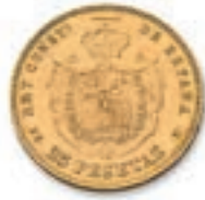
86 ESPAGNE. ALPHONSE XII (1874-1885). 25 pesetas. 1878. (Fr. 342). Or. Très Beau. 250 / 350 €