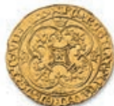
10 Ecu d'or à la couronne. (Dy. 369, L. 376). 3,96 g. Très Beau. 400 / 500 €