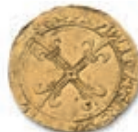
14 LOUIS XII (1498-1514). Ecu d'or au soleil. Bayonne. (Dy. 647, L. 592). FRANÇOIS I er (1515-1547). Ecu d'or au soleil. 5 ème t. 3 ème ém. Toulouse. (Dy. 775, L. 639). Ens. 2 p. 3,43 g. 3,38 g. TB à Très Beau. 400 / 500 €