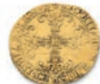
65 BELGIQUE. Brabant. CHARLES QUINT (1506-1555). Couronne d'or. 1544. (Fr. 62). PHILIPPE IV d'Espagne (1621-1667). Couronne d'or. Bruxelles. 1632. (Fr. 110). Ens. 2 p. 3,37 g. 3,32 g. TB à Très Beau. 500 / 700 €