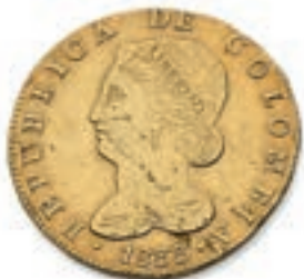
68 COLOMBIE. Bogota. 8 escudos. 1833. (Fr. 67). TB à Très Beau. 800 / 1 000 €